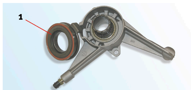
Billede 1: 510 0016 10