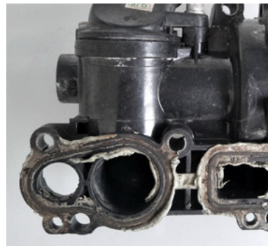
Fig. 5 : Fuites dues à des produits d'étanchéité supplémentaires (vue du dommage)