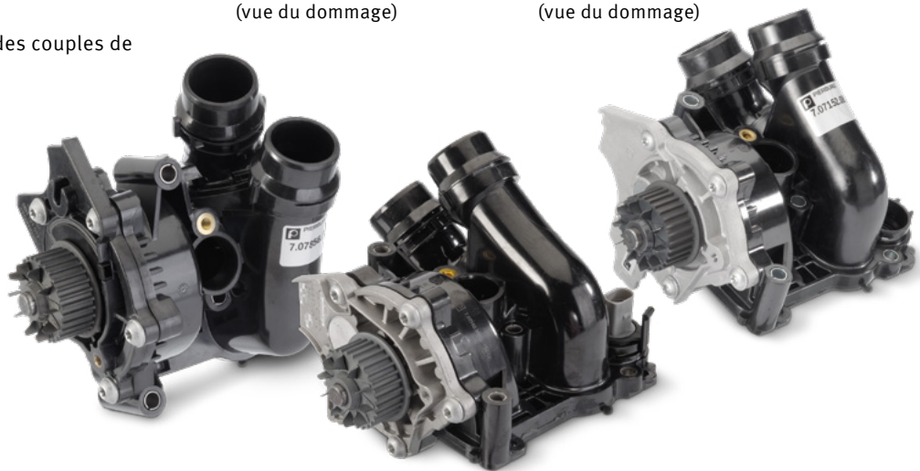
Fig. 1 : Vue du produit

Sous réserve de modifications et de variations dans les illustrations. Pour les références et les pièces de rechange, voir les catalogues actuels ou les systèmes se basant sur les données TecAlliance.