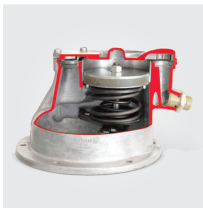
Une pompe à vide à piston classique (modèle en coupe)