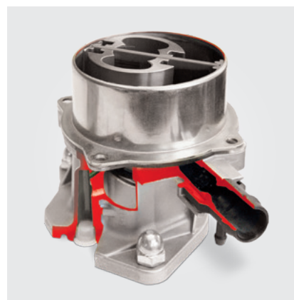
Technique actuelle : pompe à vide à une seule ailette (modèle en coupe)

Réutilisation d'une pompe à vide usagée sur un moteur révisé : Les pompes à vide sont liées au moteur et raccordées au circuit d'huile du moteur selon le type de construction. Après une panne de moteur, il se peut que :