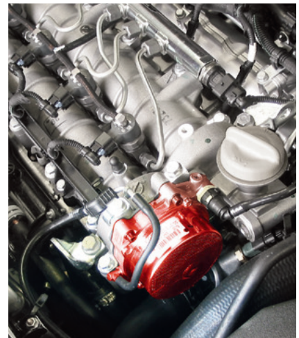
Pompe à vide installée dans une Opel Vectra C (en rouge)

Sous réserve de modifications et de variations dans les illustrations. Pour les références et les pièces de rechange, voir les catalogues actuels ou les systèmes se basant sur les données TecAlliance.