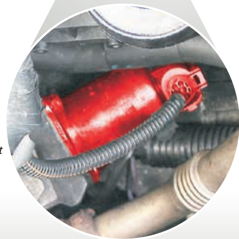
Клапан системы EGR в Renault Master JD1M (выделен)