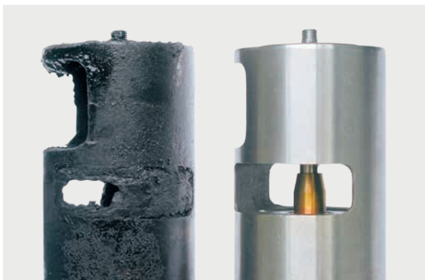
Залипший клапан системы EGR и новый клапан

Указания по диагностике и возможные причины → см. следующие страницы