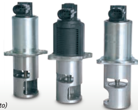
Vista del producto (extracto)

Modificaciones y cambios de dibujos reservados. Para la colocación y la sustitución, véanse los catálogos, el CD TecDoc y/o los sistemas basados en datos TecDoc.