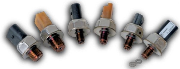
Датчики давления топлива