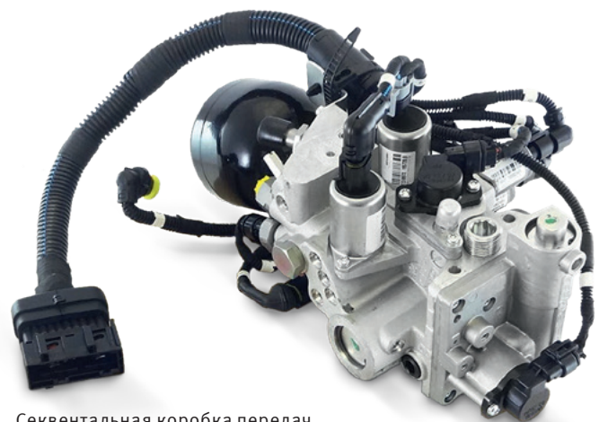
Секвентальная коробка передач Selespeed (Alfa Romeo)

Мы сохраняем за собой право на изменения и несоответствие рисунков. Информацию об идентификации и замене см. в соответствующих каталогах или в системах, основанных на TecAlliance.