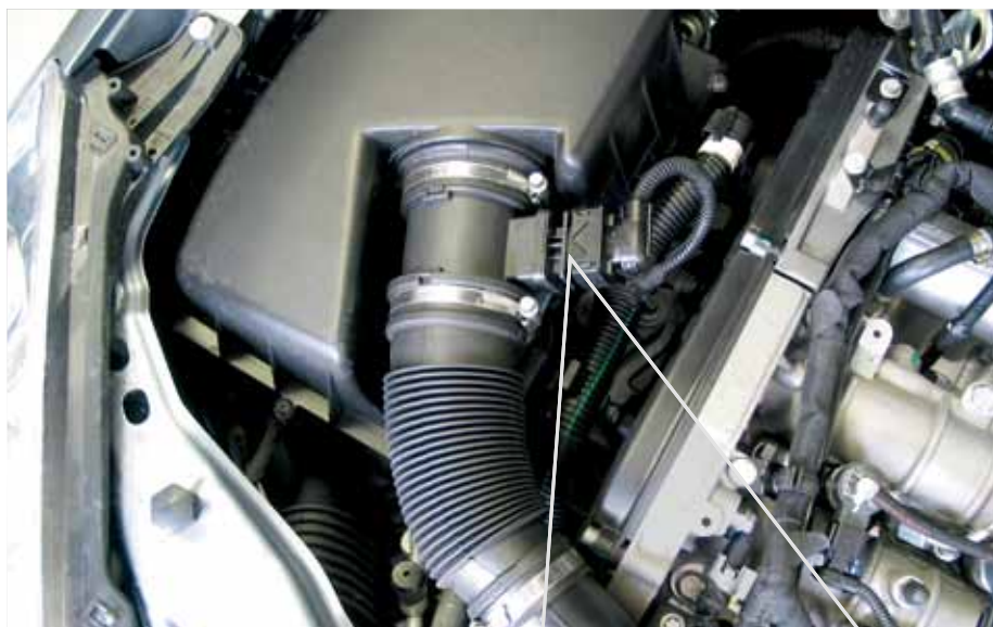
Sensor de massa de ar soldado

Seguir-se-ão outras referências de artigos com aplicações para BMW, Mercedes-Benz, Opel e Fiat.