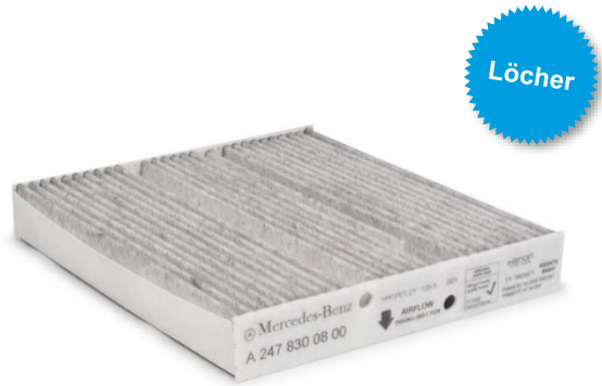
Bild 2: Die OE-Filter sind mit zwei Löchern und einem separaten Deckel versehen. Zwei im Gehäuse befindliche Zapfen dringen in den Filter ein, genauso wie die beiden Zapfen am Deckel.